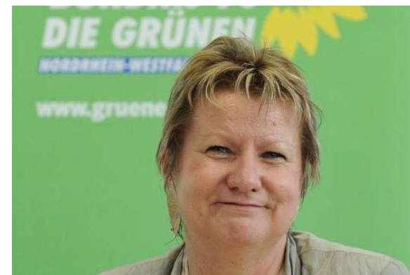
Ministerin Sylvia Löhrmann

Diese Nachricht wurde später als eine nicht authentische Mitteilung der Ministerin ausgegeben.